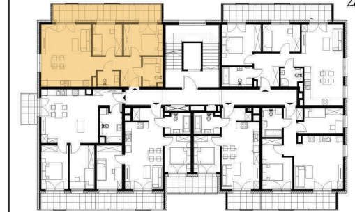
Rzut w skali 1:200