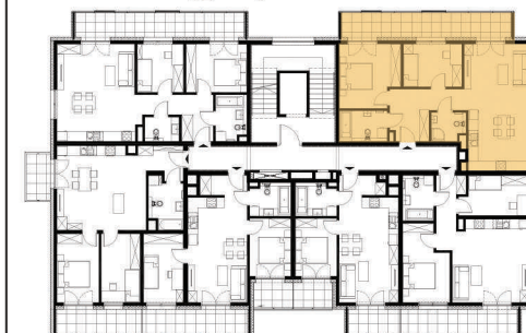
Rzut w skali 1:200