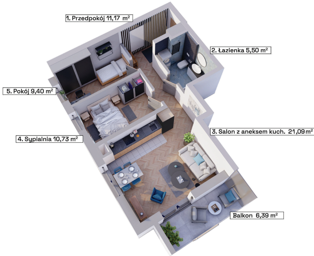
Schemat kondygnacji +2