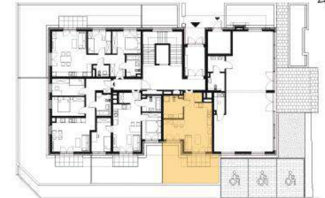
Rzut w skali 1:200