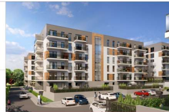
Schemat kondygnacji Piętro +1