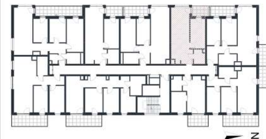
Rzut w skali 1:180