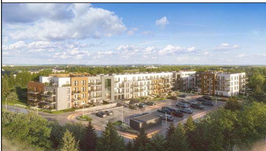
SCHEMAT LOKALIZACYJNY PARTERU